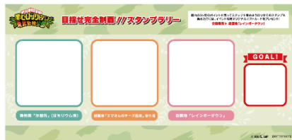
▲スタンプラリー台紙