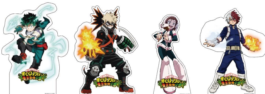
【ヒーローコスチュームを着用したパネルイメージ】